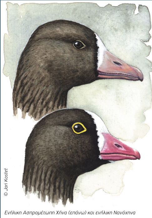
Ενήλικη Ασπρομέτωπη Χίνα (επάνω) και ενήλικη Νανόχχνα

Πολλά παραμένουν ακόμα άγνωστα για τη Νανόχχνα, κυρίως σχετικά με τις μεταναστευτικές της διαδρομές και τις περιοχές διαχείμασης. Στο πλαίσιο του Προγράμματος LIFE+ για τη Νανόχχνα και με σκοπό τη συλλογή πληροφοριών και δεδομένων για το είδος, δημιουργήθηκε μία διαδικτυακή φόρμα καταγραφής στον ιστότοπο: