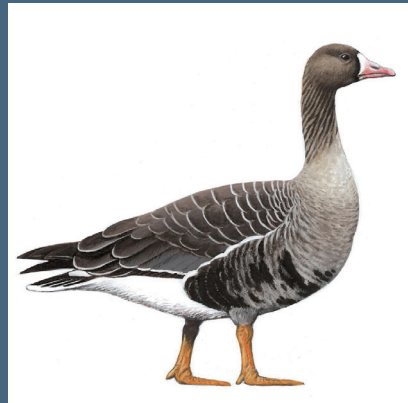
Ενήλικη Νανόχηνα (αριστερά) και ενήλικη Ασπρομέτωπη Χήνα