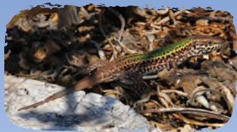
Η σαύρα «γίγας» Podarcis gaiigae που ζει στο νησάκι Διαβατές έχει μέγεθος έως και 40% μεγαλύτερο από τις σαύρες του ίδιου είδους που ζουν απέναντι, στη Σκύρο.

Λόγω της σημασίας τους, πολλές νησίδες έχουν ενταχθεί ως Ζώνες Ειδικής Προστασίας στο ευρωπαϊκό δίκτυο Natura 2000, που περιλαμβάνει τις πολυτιμότερες περιοχές της Ευρώπης για τη διατήρηση της βιοποικιλότητας.