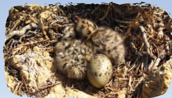
Σε αντίθεση με τα ενήλικα πουλιά που μπορούν εύκολα να απομακρυνθούν πετώντας, τα αβγά και οι νεοσσοί είναι εκτεθειμένα στο έλεος των θηρευτών.